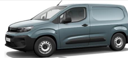
Lichtblauw Metallic M0M6 € 600 (726)