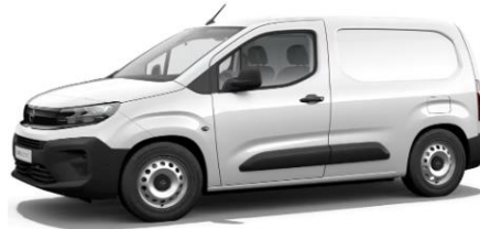
WIT POPR € 0 (0)