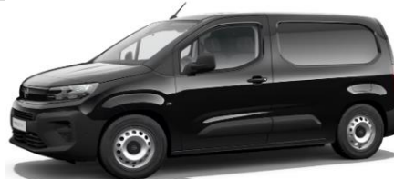
Zwart Metallic M09V € 600 (726)