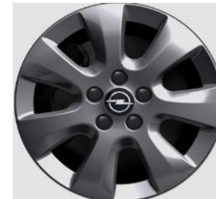
16" Lichtmetalen velgen TARANAKI