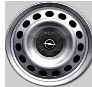
Standaard 16" Wioldoppen