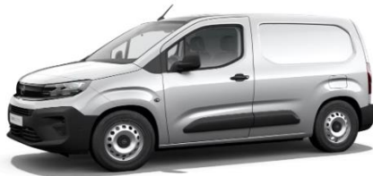
Lichtgrijs Metallic M0F4 € 600 (726)