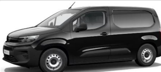
Zwart Metallic M09V € 600 (726)