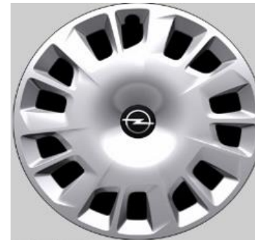
16" volwaardige wioldoppen TONGARIRO (i.c.m. Pakket Comfort Connect Style)