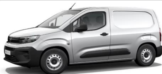
Lichtgrijs Metallic MOF4 € 600 (726)