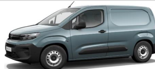
Lichtblauw Metallic M0M6 € 600 (726)