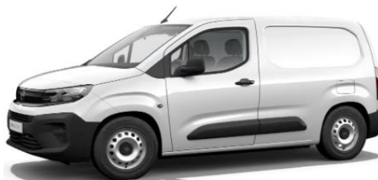
WIT POPR € 0 (0)