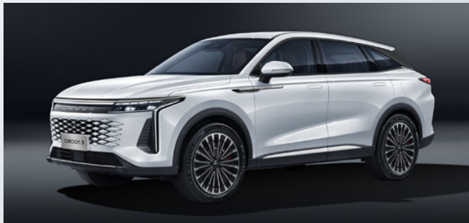
OMODA 9 SHS-P | STARY WHITE

Standaard ingebrepen: Stary White: €0,00 Zwart interieur met lichtgrijze hemelbekleding: €0,00