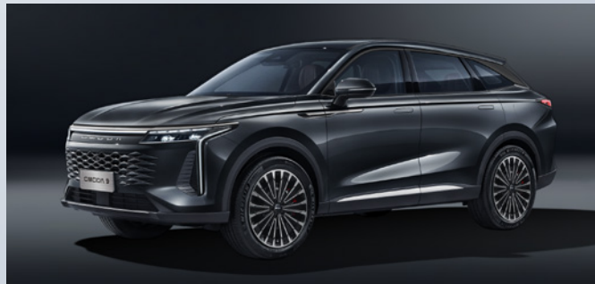
OMODA 9 SHS-P | CALLIGRAPHY INK BLACK

Standaard ingebrepen: Stary White: €0,00 Zwart interieur met lichtgrijze hemelbekleding: €0,00