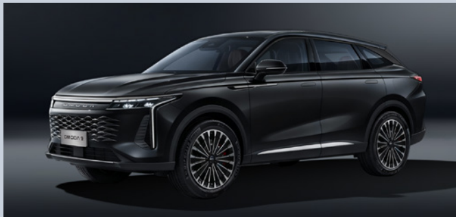
OMODA 9 SHS-P | MATTE BLACK