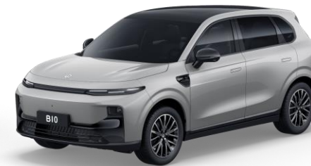
Tundra Grey (non metallic) €750 Bestelcode: 0GD