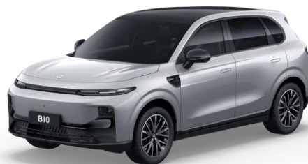
Galaxy Silver (metallic) €750 Bestelcode: 0DS