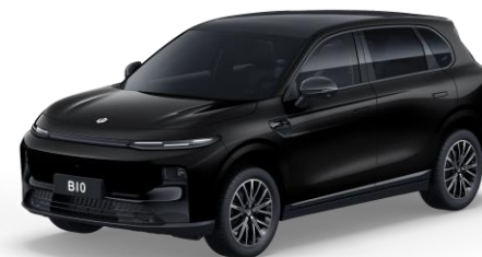
Metallic Black (metallic) €750 Bestelcode: 0KL