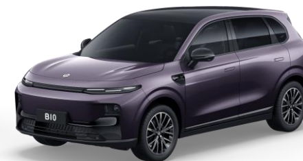
Dawn Purple (metallic) €750 Bestelcode: 0UB