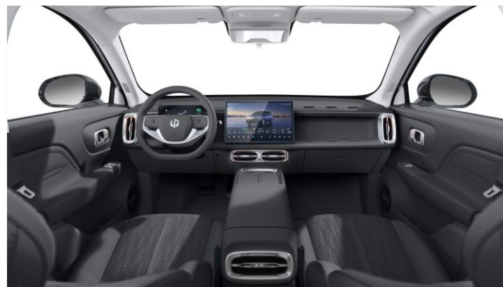
Shadow Grey Eco Leather