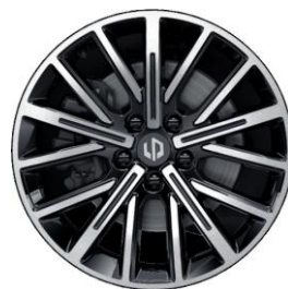
18" lichtmetalen velgen