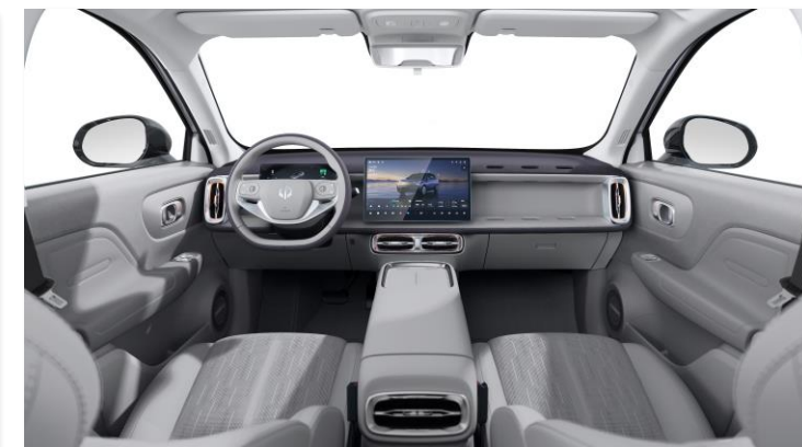
Light Grey Eco Leather