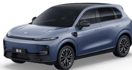
Starry Night Blue (metallic) €0 Bestelcode: 0XC