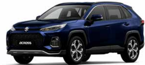
Dark Blue Mica (8X8)*