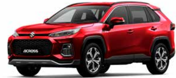
Sensual Red Mica (3T3)**