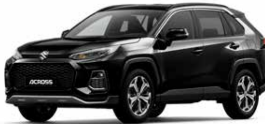
Attitude Black Mica (218)*