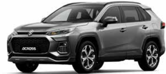
Gray Metallic (1G3)*