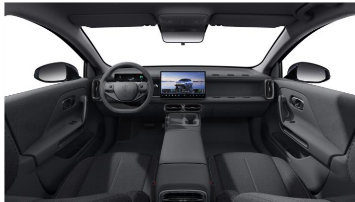
Stoffen bekleding zwart Bestelcode: OCL