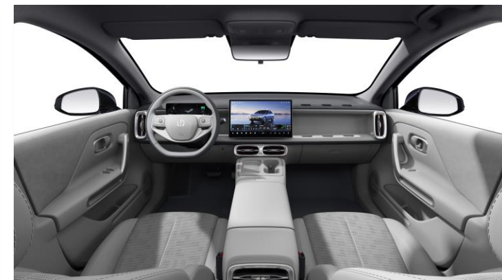
Light Grey Eco Leather Bestelcode: ODN