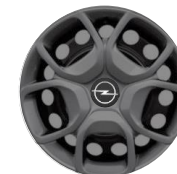
17-INCH WIELKAP ZHYY Standaard bij Exterieur pakket