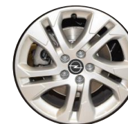
17-INCH LICHTMETAAL ZHZL € 650,00 (787)