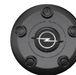
WIELNAAFDEKKING ZHYV, ZHYW, ZHZQ Standaard