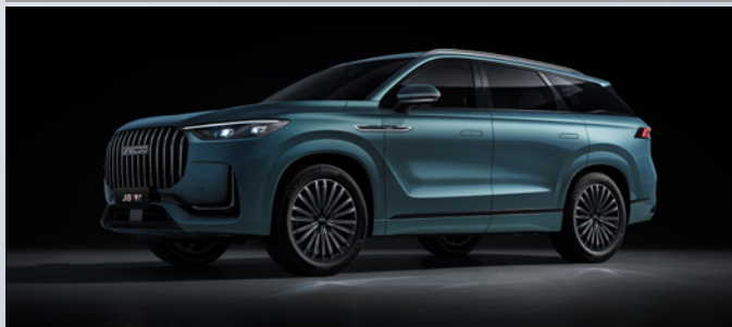
JAECOO J8 SHS-P | OLIVE GRAY