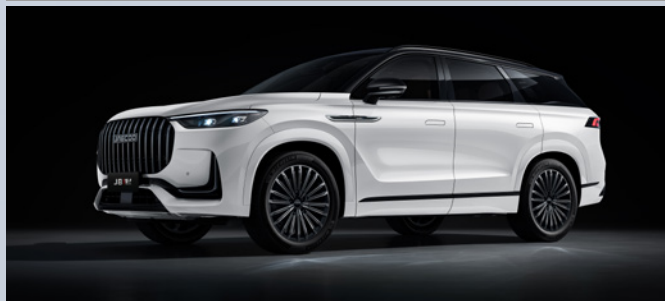
JAECOO J8 SHS-P | KHAKE WHITE BLACK ROOF