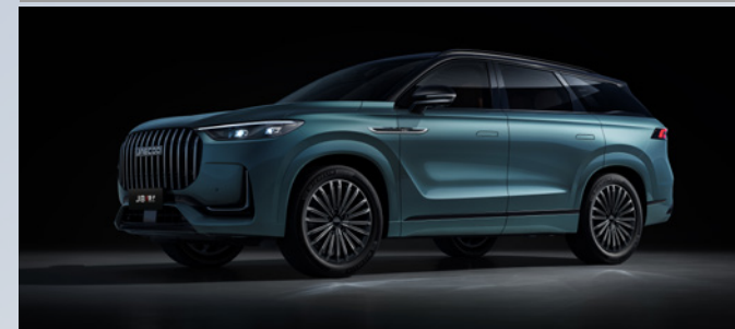
JAECOO J8 SHS-P | OLIVE GRAY BLACK ROOF