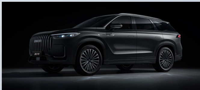
JAECOO J8 SHS-P | CARBON CRYSTAL BLACK

Standaard ingebrepen: Khaki white: €0,00 Zwart interieur met lichtgrijze hemelbekleding: €0,00