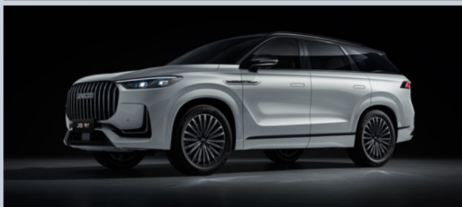
JAECOO J8 SHS-P | IRIDIUM LUSTRE SILVER BLACK ROOF

Iridium Lustre Silver & Black Roof: €1350