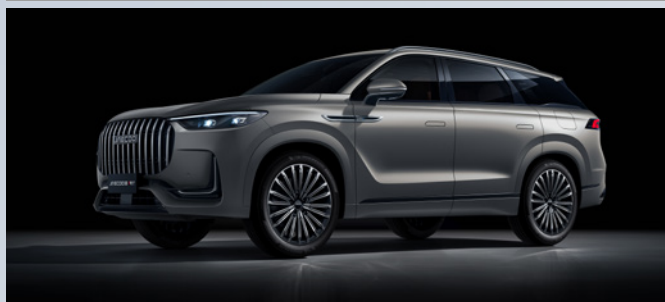
JAECOO J8 SHS-P | MATTE GRAY

Iridium Lustre Silver & Black Roof: €1350