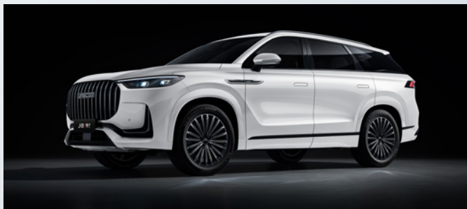
JAECOO J8 SHS-P | KHAKE WHITE

Standaard ingebrepen: Khaki white: €0,00 Zwart interieur met lichtgrijze hemelbekleding: €0,00