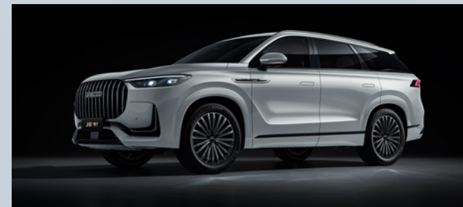
JAECOO J8 SHS-P | IRIDIUM LUSTRE SILVER